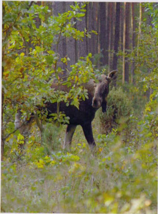
Popletený biebrzański los civí na český autobus ↑