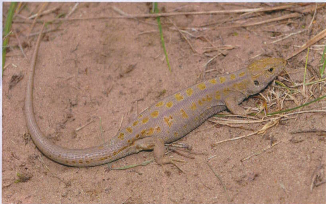
Ještěrka obecná ale žije v Biebrzańském národním parku na zarostlých písečných přesypech.