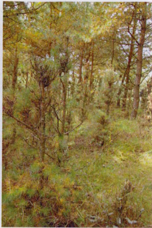
Keře okousané od losa ↑