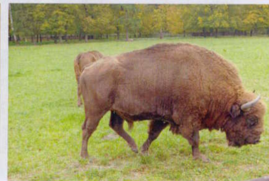
a zubr ↑ z Białowieže