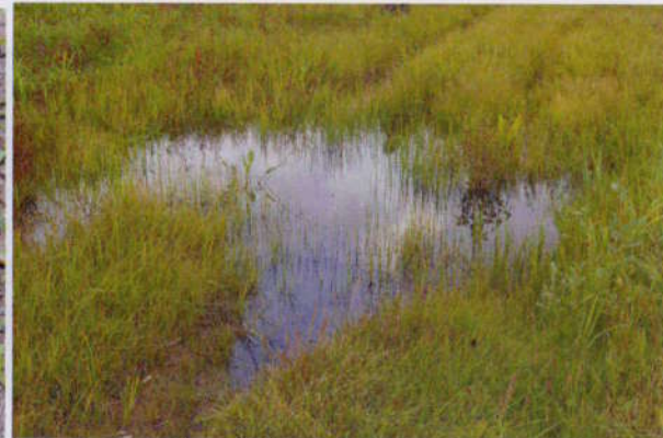
a louže ↑ z Biebrzańskiego národního parku