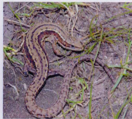
Ještěrka živorodá ↑