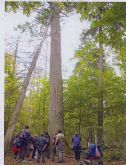
Białowieża -pod staletými velikány pralesa