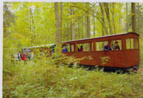
TSP cestuje i netradičními dopravními prostředky, jako jsou Pychówki (←) a kolejka leśną (↑). Nejčastější žába na Biebrze je skokan ostronosý ↓