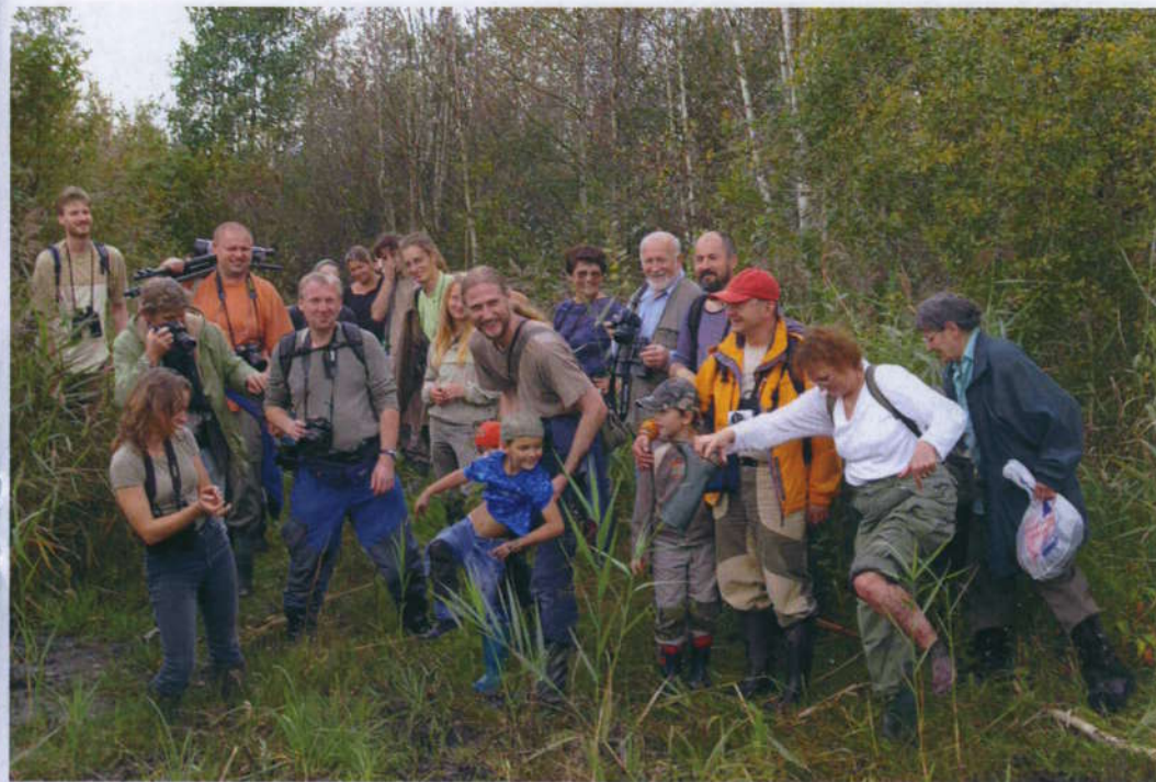
"Bagna Biebrzańskie - to wciaga !!!"

Městečko Tykocin je skutečně krásné, i když na nás dolehla prázdnota po chybějící polovině zdejších obyvatel - Židů - kteří byli za druhé světové války postřílení během dvou dnů v nedalekém lese. S další zdejší menšinou – polskými Tataři – jsme se seznámily ve vzdálené obci Kruszyniany přímo u běloruských hranic. Mladý Tatar nás provedl mešitou a muslimským hřbitovem. Tataři už nejsou to, co bývali. Již od 17. století mluví výhradně polsky a v posledních desetiletích není již jejich hlavním zaměstnáním vojenské řemeslo. Proto jich také většina odešla za práci do velkých polských měst, ale do