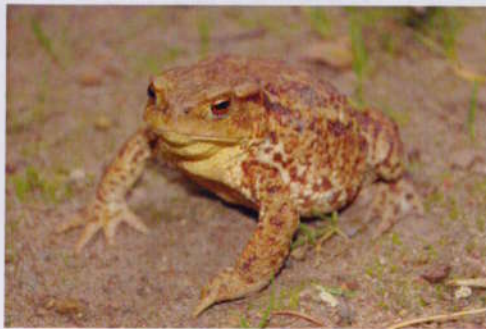
Obrovská ropucha obecná ↑