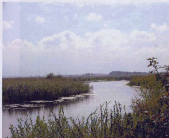
Vnitrozemská delta řeky Narew-polská Amazonie